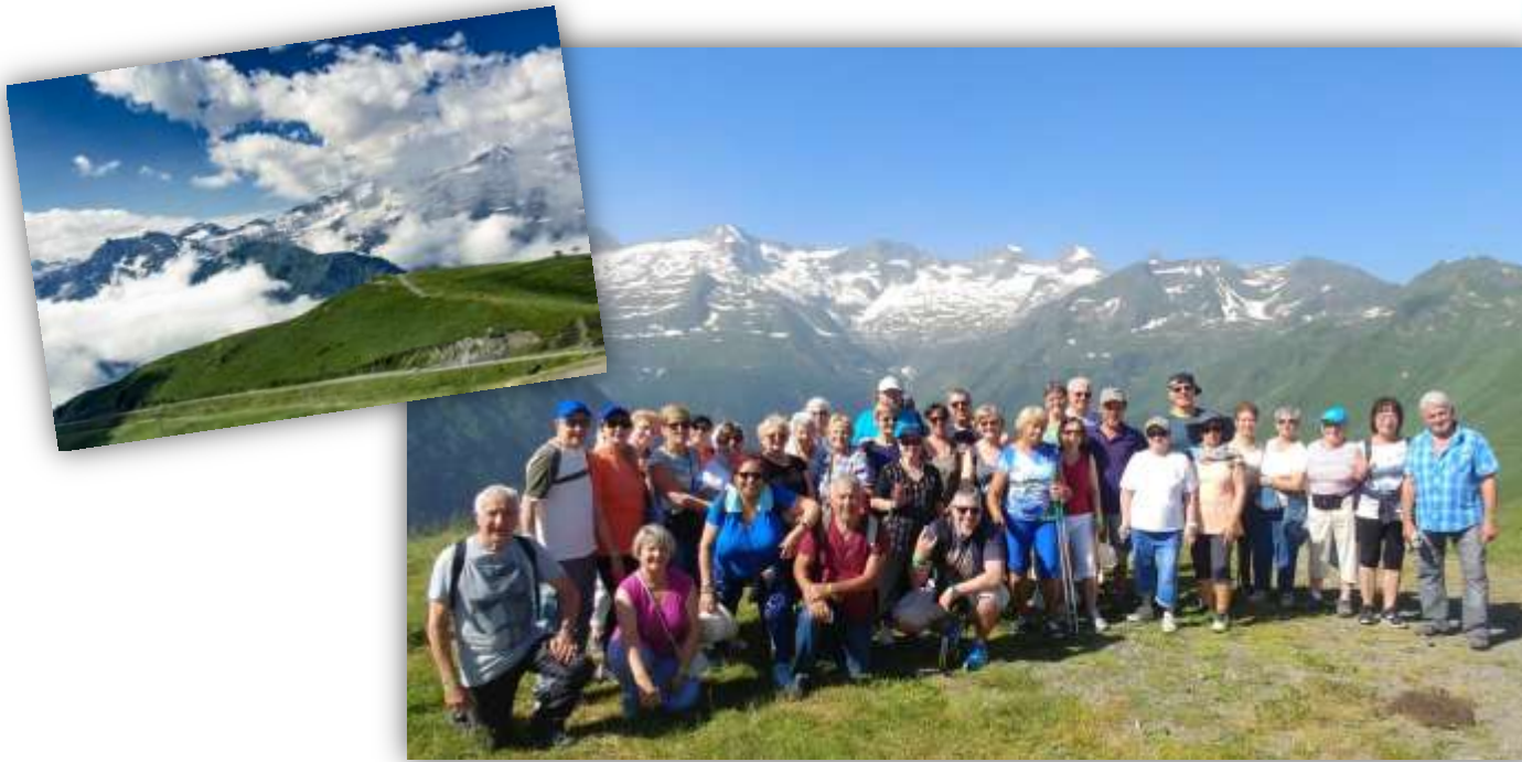
Les retraités d'Aubagne au Village Club du Soleil « Le Grand Hôtel » en juillet 2018