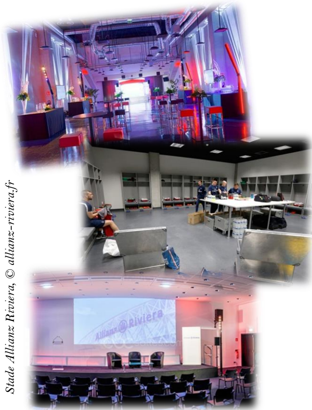
Stade Allianz Riviera