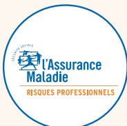
Carsat, Cramif ou CGSS/CSS en outre-mer

calcule et notifie le taux AT/MP sur net-entreprises.fr