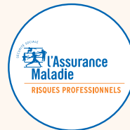
CPAM ou CGSS/CSS en outre-mer