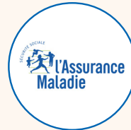
CPAM ou CGSS/CSS en outre-mer